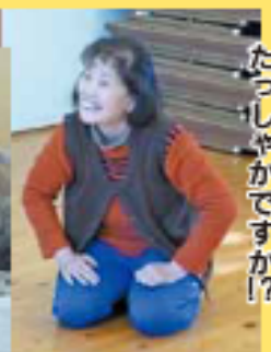
たっしやかですか!?