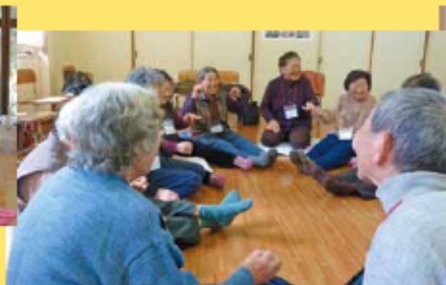
指運動実施中「あれ～、間違っちゃた!」