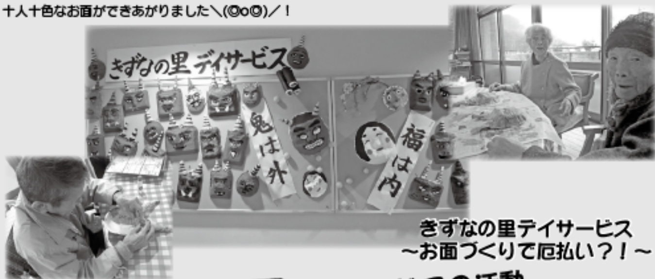
きずなの里デイサービス ～お面づくりで厄払い?!～