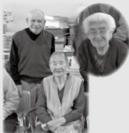
八幡荘デイサービス ～笑顔いっぱいひな祭り～