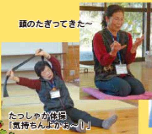
たっしやか体操 「気持ちんよかあ～!」