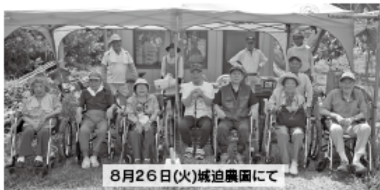
8月26日(火)城迫農園にて