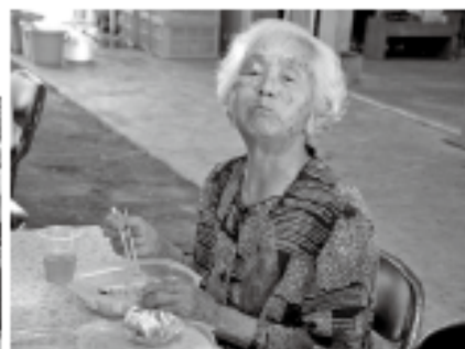
外で食ふれば、ご飯もそおん、ウマか(^^)