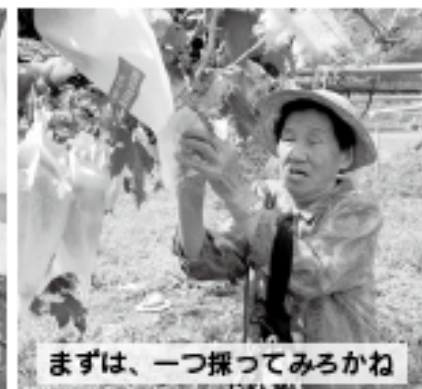
まずは、一つ探ってみろかね