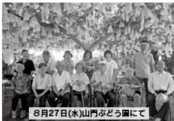
8月27日(水)山門ぶどう園にて