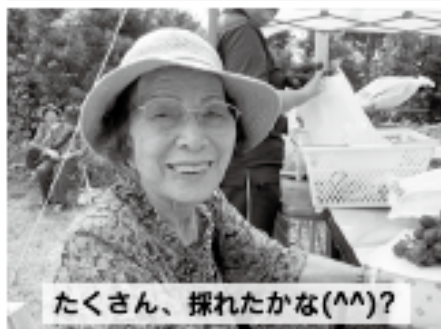
たくさん、採れたかな(^^)?