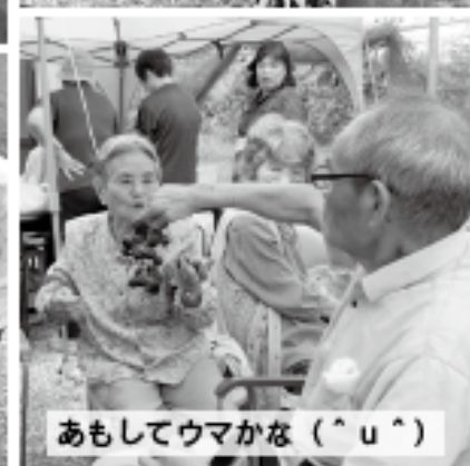
あもしてウマかな(^u^)