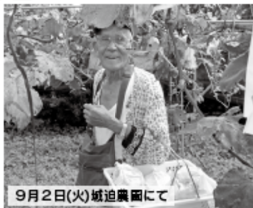
9月2日(火)城迫農園にて