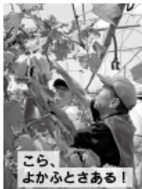
こら、よかふとさある!