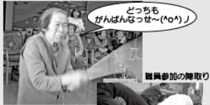
職員参加の陣取り