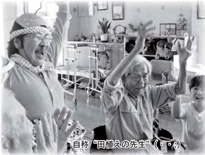
自称“田植えの先生”(・o・)

八幡荘デイサービスセンターでは、ミニ田植えを行いました。利用者の皆さまや田植えの先生の指導のおかげで、きれいに植えることができました。秋の収穫が楽しみです。