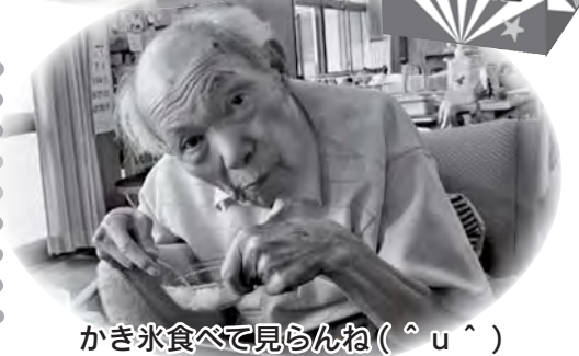
かき氷食べて見らんね(^u^)

きずなの里デイサービスセンターでは、毎年恒例の夏祭りを開催しました。昼食やかき氷などでお腹を満たしたところで、水風船釣りや抽選会を行いました。きっと、利用者の皆さまのいい夏の思い出づくりになったかと思います。