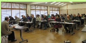
山都町社協での視察研修の様子

地域福祉活動事業を行う際に必要な事務経費や地域福祉活動推進員の育成（研修会開催や活動保険料等）に係る経費に活用させていただきます。