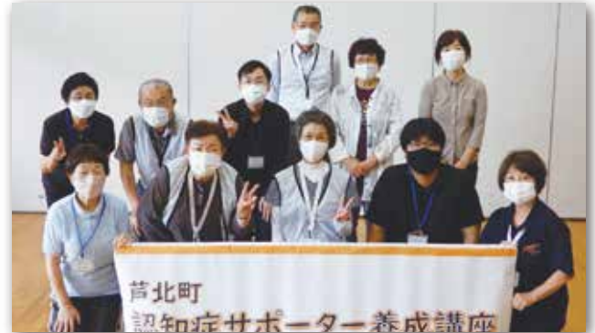
▲認知症サポーター養成講座の修了者