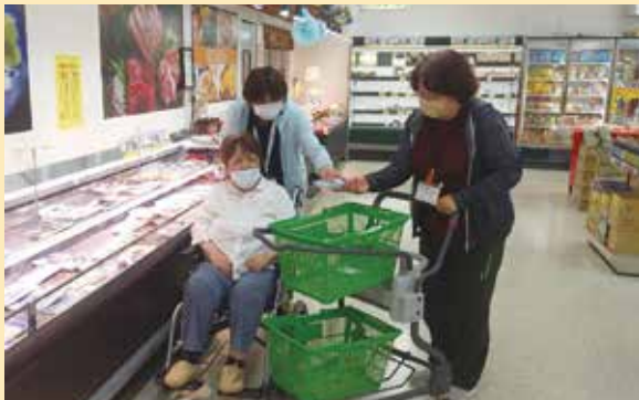
▲父ちゃんに土産ば買っていかんばん!!

きずなの里デイサービスセンターでは、湯浦ショッピングセンターペアへ買い物へ行きました。普段買い物に行く機会が少ないご利用者様も参加され、スタッフと一緒に目当ての商品を見つけておられ、とても嬉しかったです。