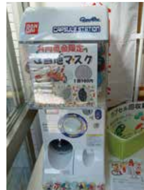
▲カプセルトイ (きずなの里)