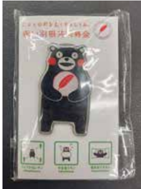
▲ピンバッジ (きずなの里)