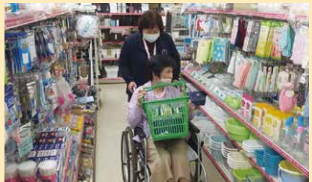
▲たくさん品物のあって見つけきらんよ