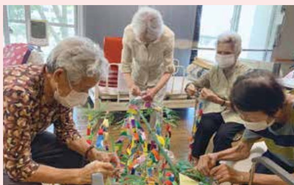
▲願いを込めて飾りつけ!!

7月行事の一環として 七夕飾りを作成しました。 皆様、和気あいあいと 楽しく取り組んでおられ ました。 また、毎月季節を感じ るカレンダーを作成し、 ご自宅で活用されたり、 楽しみのある生活を送ら れるように支援していま す。