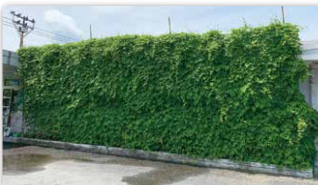
▲皆様のご協力で復活!