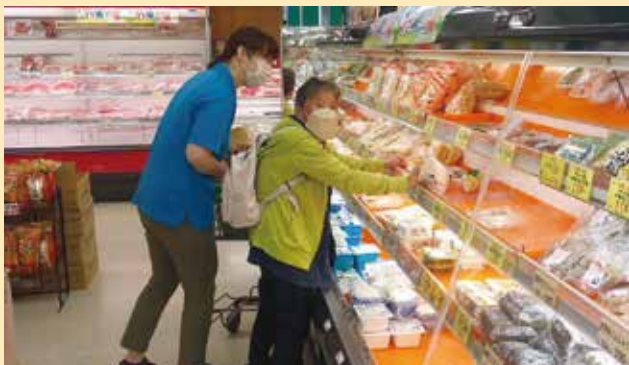
▲今夜は何ば作ろかねえ

きずなの里デイサービスセンターでは、湯浦ショッピングセンターペアへ買い物へ行きました。普段買い物に行く機会が少ないご利用者様も参加され、スタッフと一緒に目当ての商品を見つけておられ、とても嬉しかったです。