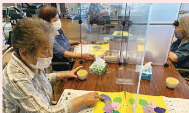
▲夏野菜のナス ようできたなあ～