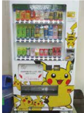
▲自動販売機 (きずなの里御休み処前 八幡荘、芦北町役場田浦支所)