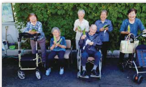
▲今年も太かとのなったよお～