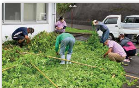
▲強風にあおられて倒れてしまった