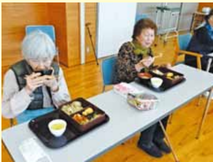
▲お花見弁当美味しかね(*'ω'*)