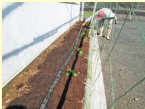
▲水撒きホースを設置