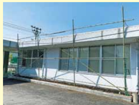
▲グリーンカーテン設置完了！