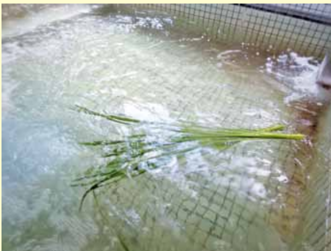
▲さわやかな香りでリラックス

5月5日（金）は菖蒲を湯に浮かべて浸かることで厄災を払うと言われており、ご利用者の皆様が無病息災で健康に過ごせるようにと願いました。普段から温泉に入浴されているご利用者様ですが、年に一度の菖蒲湯をゆったりと楽しんでおられました。