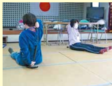
▲二人で協力した体操指導