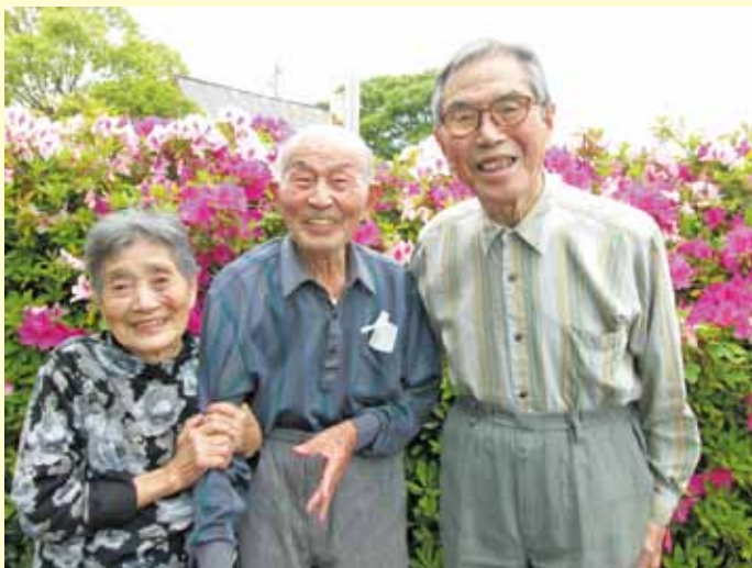
▲つつじに負けない満開の笑顔！