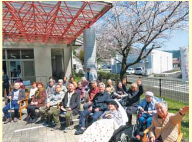
▲記念撮影を行うご利用者様

当日は天気も良く、温かな日差しの中、満開の桜の下で皆様の心も弾み、満面の笑みで記念写真を撮られていました。