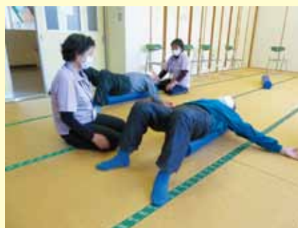
▲ストレッチ運動の補助