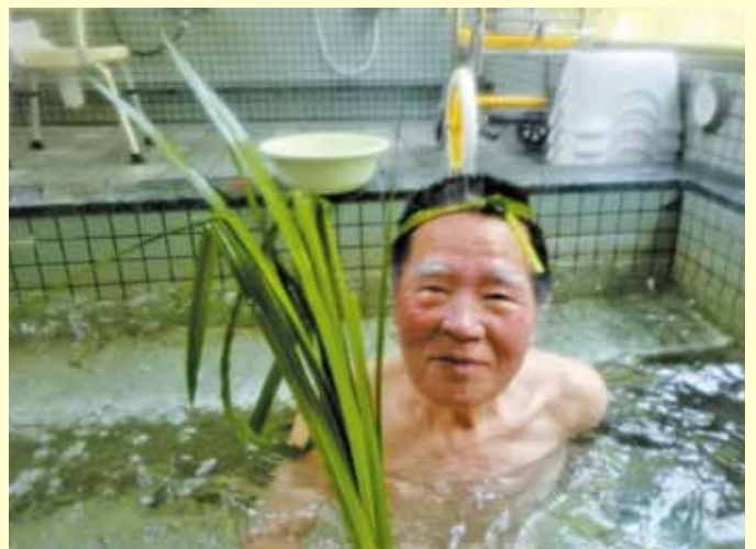
▲菖蒲のハチマキ似合ってます！