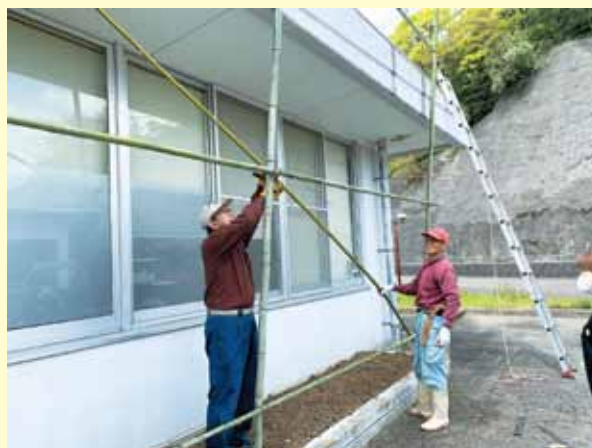
▲グリーンカーテン作製中