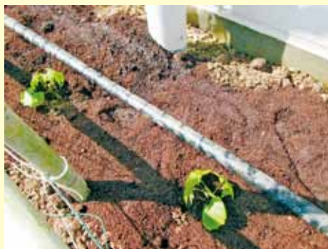
▲蛇口をひねれば水撒き開始