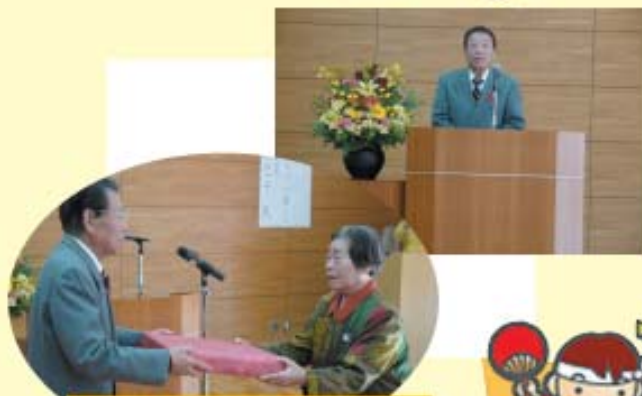
一人だけの金婚式

平成24年12月21日 発行 編集発行 芦北町社会福祉協議会 熊本県芦北郡芦北町大字湯浦1439-1 (きずなの里内) TEL:0966-86-0294 HP:http://www.ashikita-shakyo.com