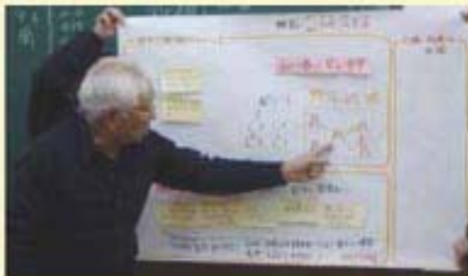
大尼田地域福祉座談会