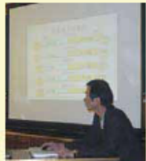
スライドによる講義