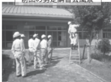
前回の剪定講習会風景