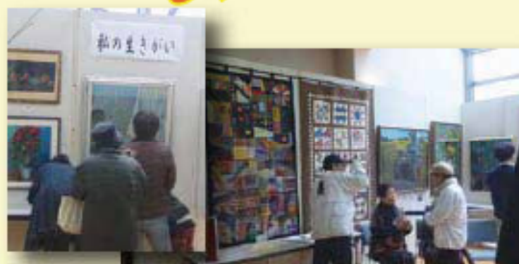
私の生きがいをテーマにした展示コーナー