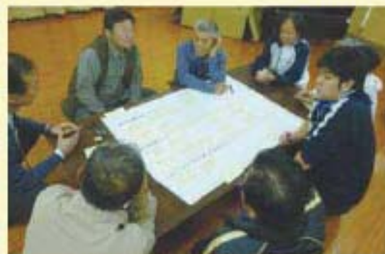
田浦3・4地域福祉座談会