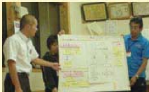
梶上地域福祉座談会