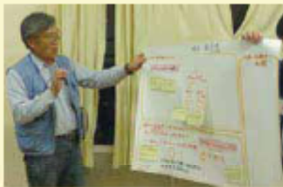
東告・西告地域福祉座談会