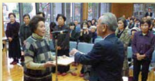
一人だけの金婚式

11月17日(日)にきずなの里にて「健康で生き生きと」をテーマにもやいまつりが開催されました。当日は、雨にもかかわらず、大勢の来場者がみえられ、一人だけの金婚式や基調講演、子ども広場、多くのボランティアさんの協力を得てバザーやステージを行うことができました。御臨席いただきました来賓の方々、御協力いただきました団体や御来場いただきました町民の皆さまのおかげで大成功に終えることができました。(関連写真P2)