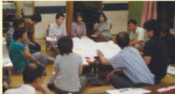
市居原地域福祉座談会