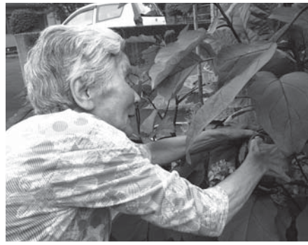
よかサイズになっとなる(〇)