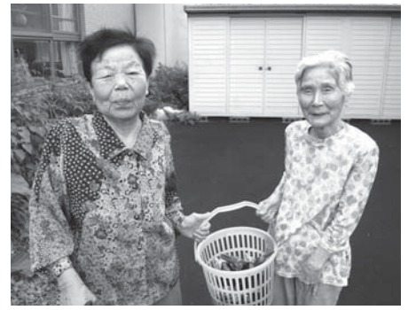
こがしこ採れたよー！