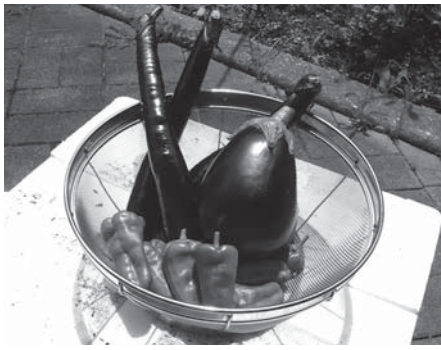
収穫したナスは煮びたしに↓