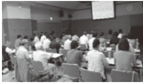
▲湯浦圏域勉強会の様子

現在、町内を5つの圏域に分けて、「連絡会」の仕組みづくりを進めています。 湯浦圏域・佐敷圏域では、6～8月にかけて「連絡会」の立ち上げに向けた勉強会を開催しました。多くの地域住民の方々に参加いただき、事業説明や住民同士の支え合いの必要性などについて