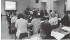
▲佐敷圏域勉強会の様子

て説明を行いました。質疑応答では、様々な質問や意見をいただきました。今後皆様とともに、芦北町に合った方法で取り組みを進めていきます。