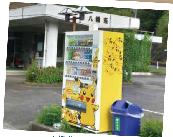
八幡荘に設置した 赤い羽根共同募金の自動販売機