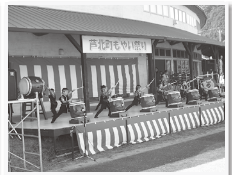
▲ 計石保育園(ステージ出演)