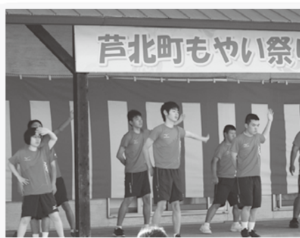
▲ 芦北支援学校高等部 (ステージ出演)