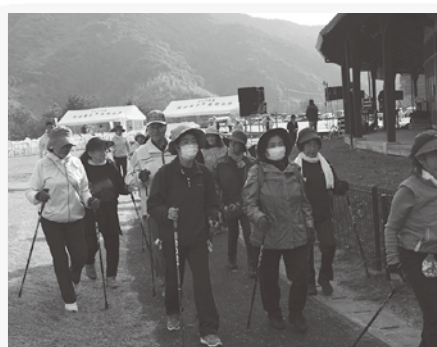
▲ ノルディックウォーキング体験会

また、ノルディックウォーキングの体験会や芦北町民生委員児童委員協議会によるチャリティーもちつき、共同募金の啓発運動、あしきた木づかい推進協議会による木育ひろばも同時開催され、秋晴れの中多くのお客様に会場いただき、大盛況に終わりました。