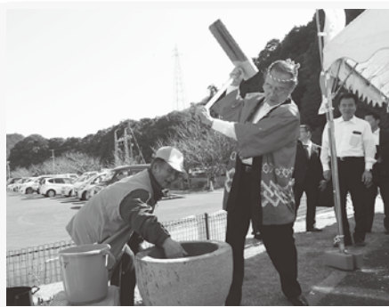
▲ 芦北町民生委員児童委員協議会 チャリティーもちつき