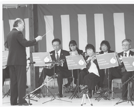
▲ 芦北マンドリンクラブ (ステージ出演)