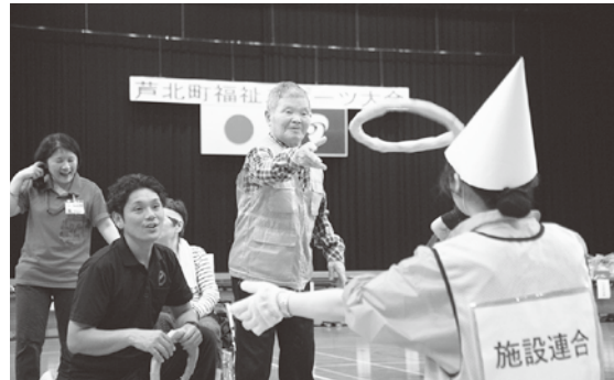
▲これくらいのもんなら朝飯前たい！！