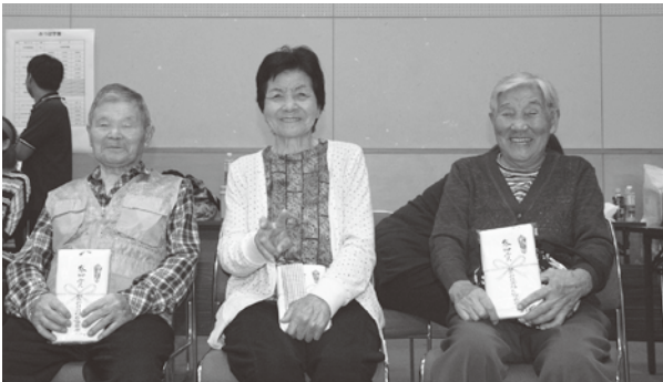
▲八幡荘の方と一緒に参加できて楽しかったバイ！ また参加しようかね！