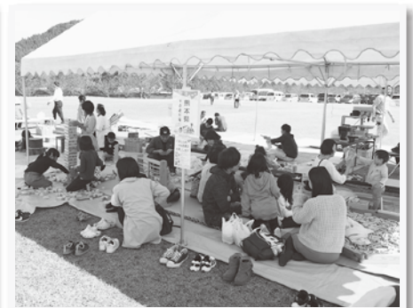
▲ あしきた木づかい推進協議会の 木育ひろば