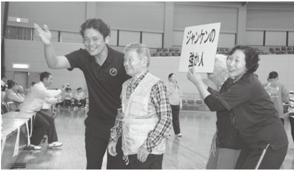
▲じゃんけんの強か人はおらんですかあ？

当日は、八幡荘デイ サービスセンターの利 用者様と一緒に輪投げ 等の競技に出場し、楽 しい一日を過ごしまし た。