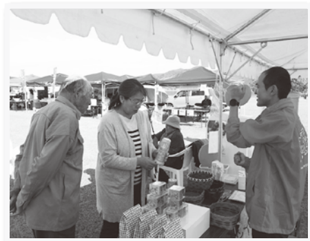
▲ 共同募金の啓発運動