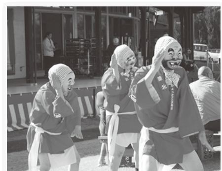
▲ 葦北ひょっとこ笑福会 (ステージ出演)